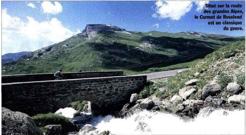
Situé sur la route des grandes Alpes, le Cormet de Roselend est un classique du genre.